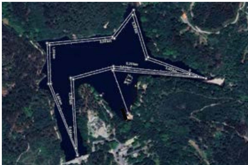
Linha de cálculo para apurar a distância aproximada da prova. (17.3. Localização das bóias e sectores – Pág. 38)