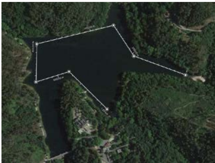
Linha de cálculo para apurar a distância aproximada da prova. (17.2. Localização das bóias e sectores – Pág. 37)