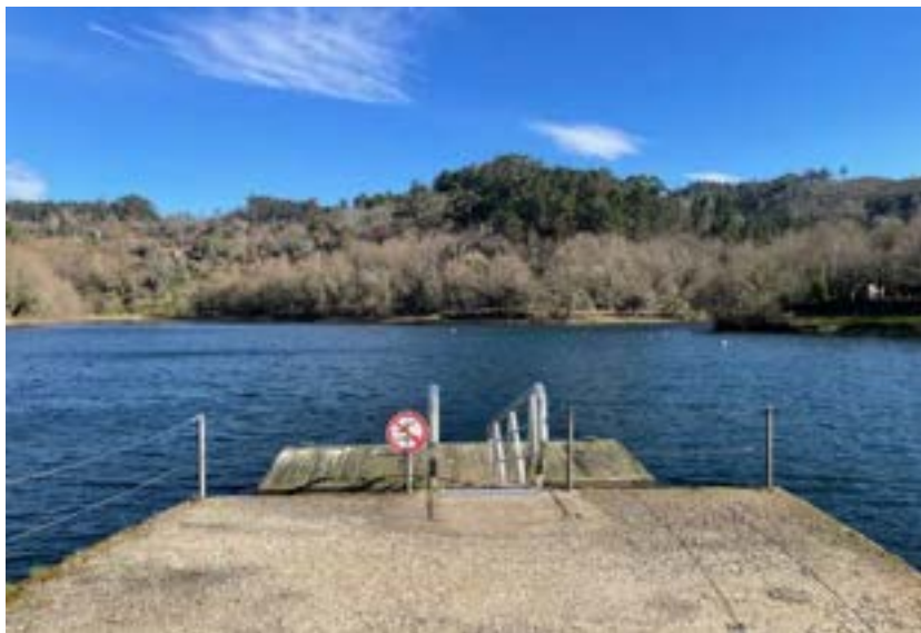
BARRAGEM DA QUEIMADELA 2026 –  GUAS ABERTAS

A Organiza o   da responsabilidade da Associa o de Nata o do Norte de Portugal (ANNP) e da C mara Municipal de Fafe (CMF) , com a colabora o da Federa o Portuguesa de Nata o (FPN) , no cumprimento dos regulamentos nacionais e internacionais para as  guas Abertas e para o Triatlo.