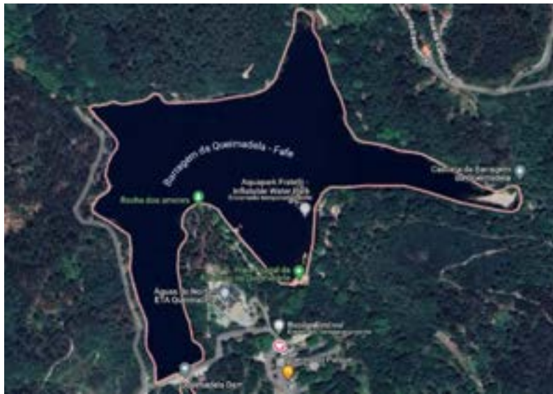
Definição da zona do percurso.

A prova 3,5 KM (Filiados AA, Masters AA e Filiados Triatlo) , pontuável para o XIX Circuito Nacional de Águas Abertas da Época 2025-2026 e para o 1º Circuito Luso-Galaico de Águas Abertas , tem uma distância de ≈3.500 metros , orientados ao longo da Albufeira da Queimadela , entre a Cascata da Barragem da Queimadela e o Parque de Merendas, num percurso em circuito (2 voltas de ≈1.500 metros / volta + 1 segmento de ≈500 metros ), no sentido horário, ficando as bóias de sinalização à direita dos nadadores, organizados segundo o integral respeito das regras da Barragem da Queimadela – Fafe .