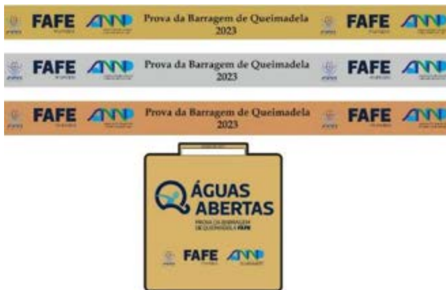
Imagem e cor ilustrativas. Podem não corresponder à versão final.