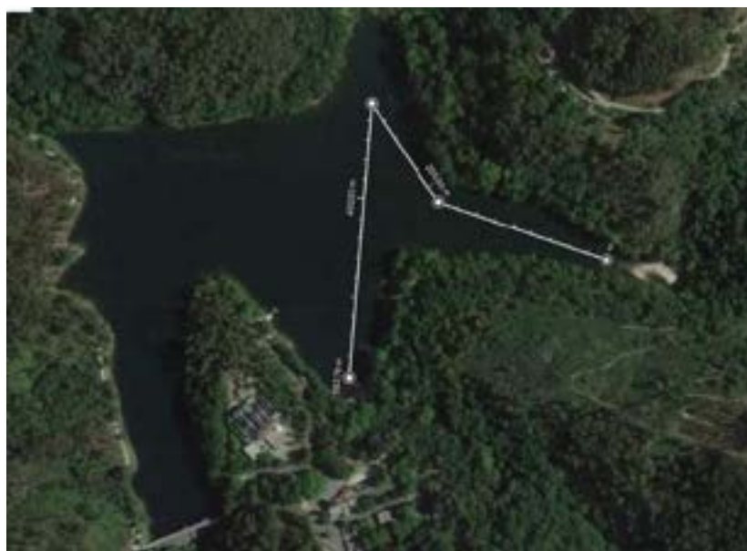
Linha de cálculo para apurar a distância aproximada da prova. (17.1. Localização das bóias e sectores – Pág. 36)