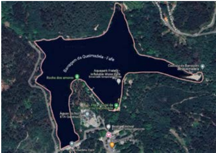
Definição da zona do percurso.

A prova 1 KM (Infantis, Adaptada, Absolutos e Cadetes Triatlo) tem uma distância de ≈1.000 metros , orientados ao longo da Albufeira da Queimadela , entre a Cascata da Barragem da Queimadela e o Parque de Merendas, no sentido anti-horário, ficando as bóias de sinalização à esquerda dos nadadores, organizados segundo o integral respeito das regras da Barragem da Queimadela – Fafe .