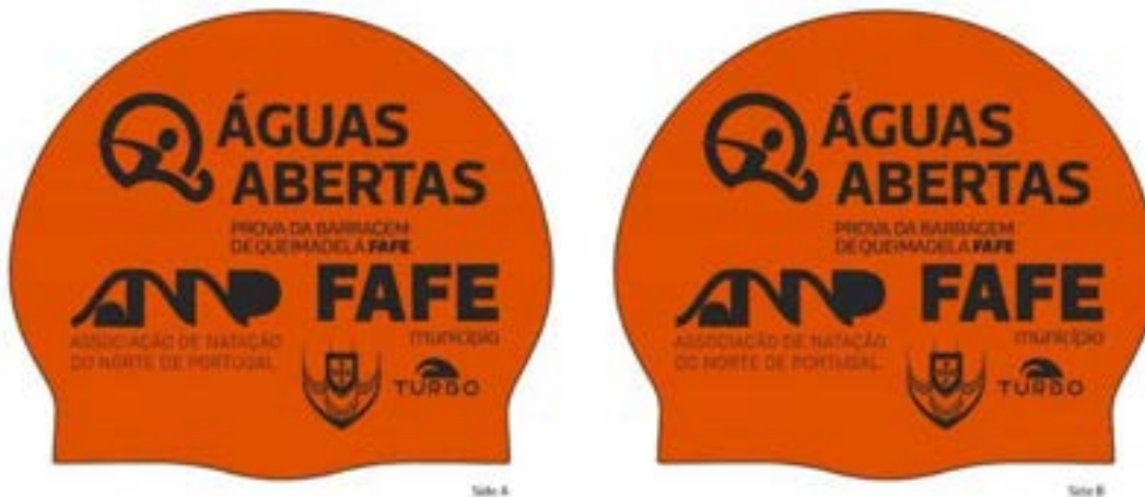
Imagem e cor podem n o corresponder   vers o final.

e) Todos os nadadores participantes recebem uma touca alusiva ao evento, de uso obrigat rio durante a prova.